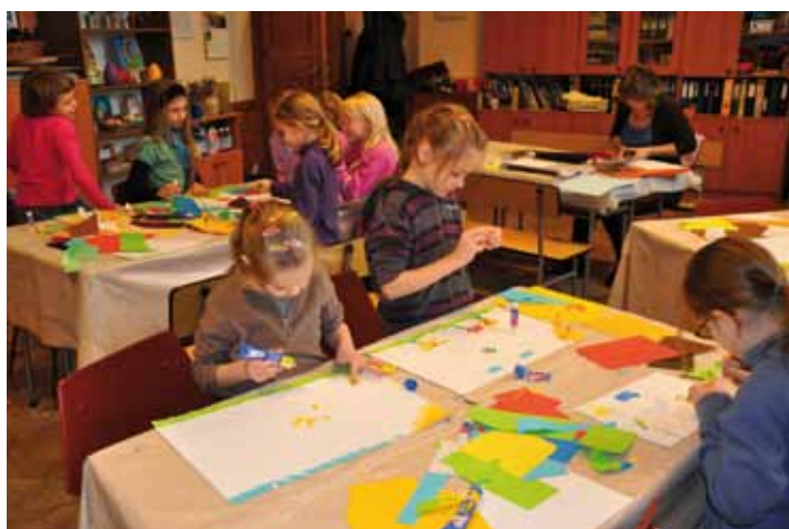
Zajęcia w pomieszczeniach parafii