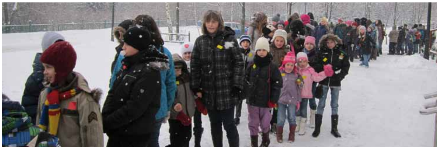
Wyjście do kina