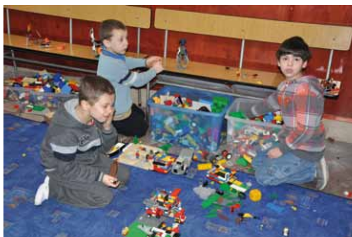
Zajęcia w pomieszczeniach parafii