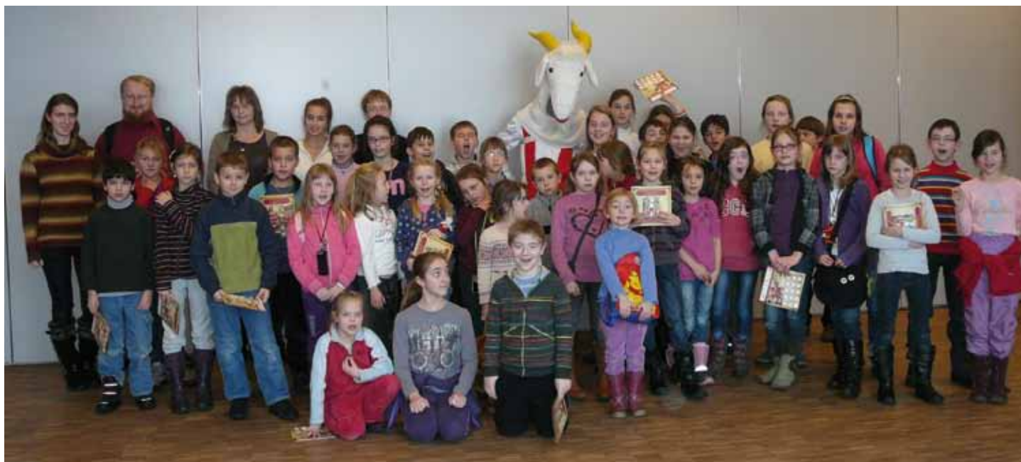
Wycieczka do Pacanowa